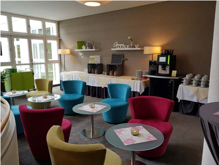
Die Genuss-Lounge für Tagungspausen.

dabei: Flexibilität und Teamgeist. Qualitäten, die in der Gastronomie ohnehin wichtig sind. „Jeder muss sich einbringen, sonst wird der Einzelne nicht glücklich.“